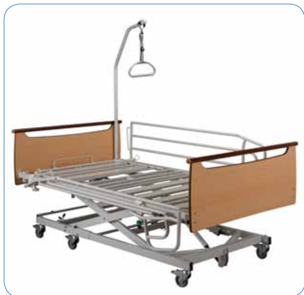
Lit XXL X'PRESS existe en 3 versions : 2 et 3 fonctions électriques avec ou sans plicature.