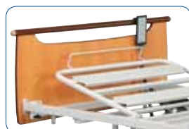
Relève-buste électrique (d'origine).