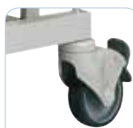
Roues Ø 100 mm.