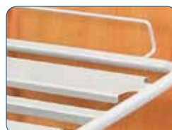
Larges lattes métalliques soudées. Elles sont conçues pour un entretien facile.