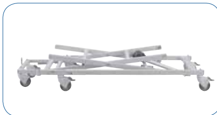
Soulevez légèrement le croisillon pour remonter la base.