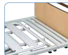
Rallonge de sommier de 20 cm.