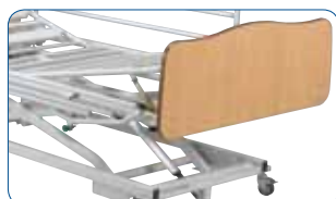
Relève-jambes manuel à crémaillères.