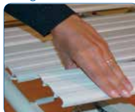
Ampie doghe staccabili in resina acrilica M2. Concepite per un maggior livello di comfort e igiene, garantiscono un'assoluta protezione anticorrosione.