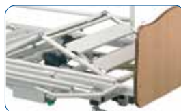
Alzagambe elettrico con piegatura.