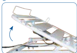
Alzabusto a traslazione. Permette di evitare uno scivolamento in avanti.