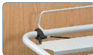
Sgancio d'emergenza del alzabusto accessibile dalla testata e dai 2 lati del letto.

IL ALZAGAMBE: potete scegliere fra varie versioni di alzagambe.