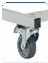
Ruote Ø 75 mm.