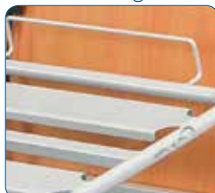
Ampie doghe in metallo saldate. Sono concepite per una facile manutenzione.

IL PIANO BASE: il piano base è costituito da doghe. Potete scegliere fra: