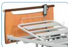
Alzabusto elettrico (originale).

IL ALZABUSTO: potete scegliere fra varie versioni di alzabusto.