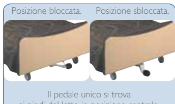
Posizione bloccata. Posizione sbloccata.