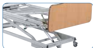
Alzagambe manuale a guide dentate.

IL ALZAGAMBE: potete scegliere fra varie versioni di alzagambe.