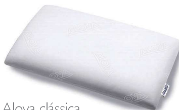
Alova clássica Ref: VSTAND 6040