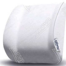
Alova apoio lombar Ref: VCALELOMB