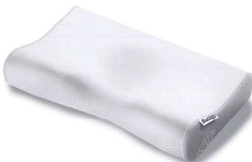
Alova cervical anatómica. Ref: VCERVA 5535