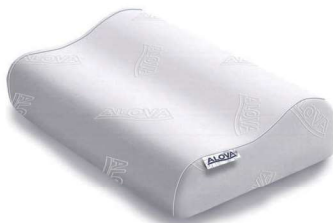
Alova cervical Ref: VCERV-5035/5042/6038 Ref: VTRAVEL-5035