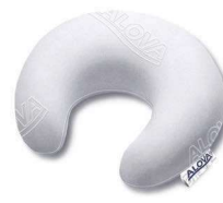
Alova apoio cervical meia-lua Ref: VDLUNE