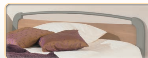
Auzence II, współczesny design, dostępne w wymiarach 140 i 160 cm.