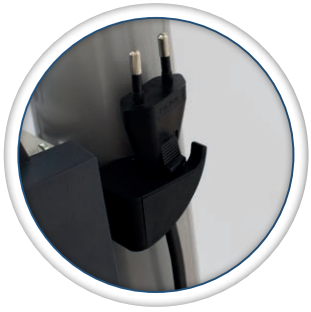
système d'accroche du câble de charge