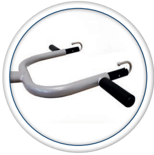
poignée d'aide à la mise en position debout