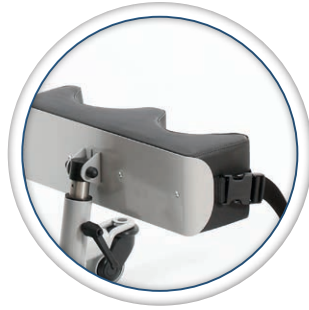
Appui tibias ajustable en hauteur et en inclinaison