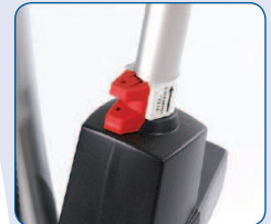
Bajada mecánica de emergencia