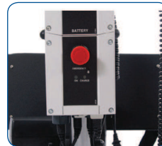
Equipo Linak con batería desmontable