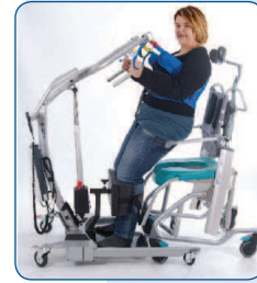
Amplia gama de ameses