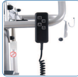
Mando con acople magnético