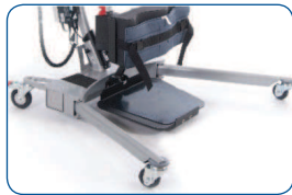
Amplia apertura de patas