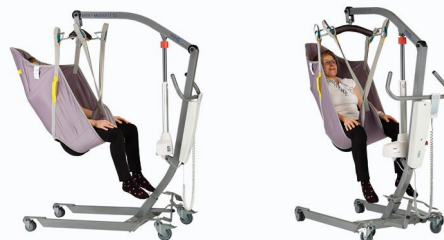
Sangle Fletty avec têteière