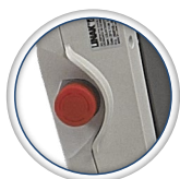
Bouton arrêt d'urgence