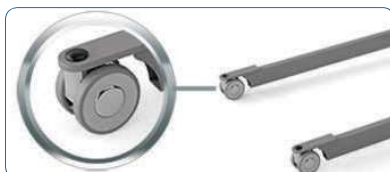
Opção: Rodas de design