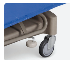
FREINAGE CENTRALISÉ en option avec 4 roues Ø 125 mm, dont 1 directionnelle.