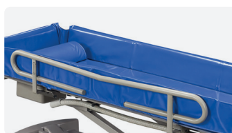
BARRIÈRES Barrières profilées escamotables, métal peint