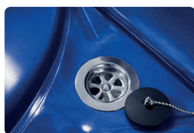
BONDE D'ÉVACUATION simple d'utilisation. Plan incliné à 2°