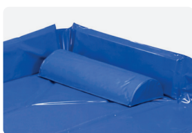
COUSSIN CYLINDRIQUE Hauteur 9,90 cm, longueur 49,7 cm, largeur 20,2 cm